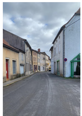
Rue de Cénevières : circulation alternée bientôt