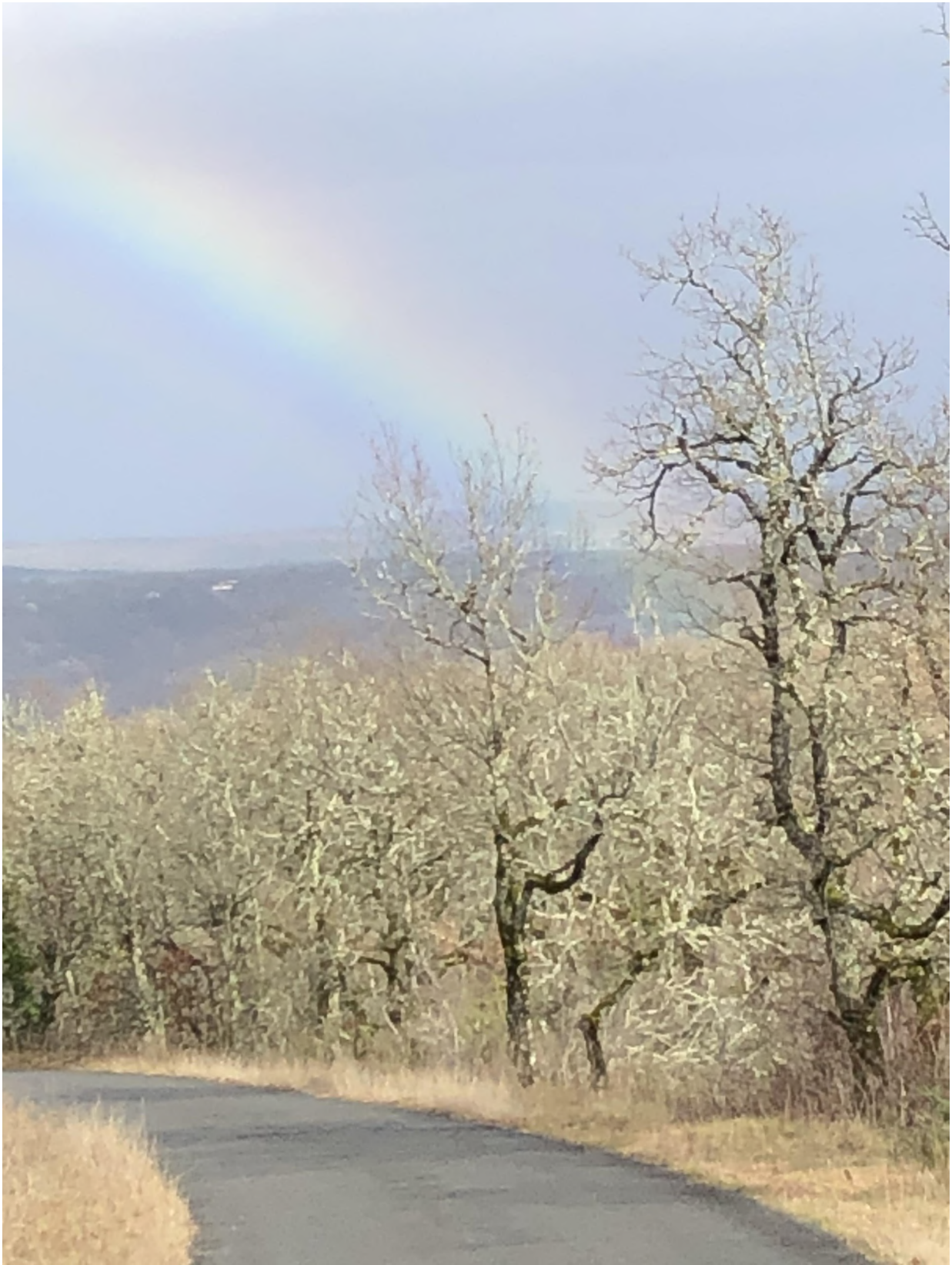
Arc-en-ciel d'hiver à Saint-Jean-de-Laur

Le Limogne infos - La Gazette - Magazine édité par la mairie de Limogne. La commission communication remercie tous les contributeurs. Rédaction : Christophe Wargny. Conception : Jean Luc Bouchard. Directeur de la publication : Jean-Claude Vialette, maire. Impression : Imprimerie Boissor, ESAT (Etablissement et service d'aide par le travail), Luzech. Tirage : 600 exemplaires.