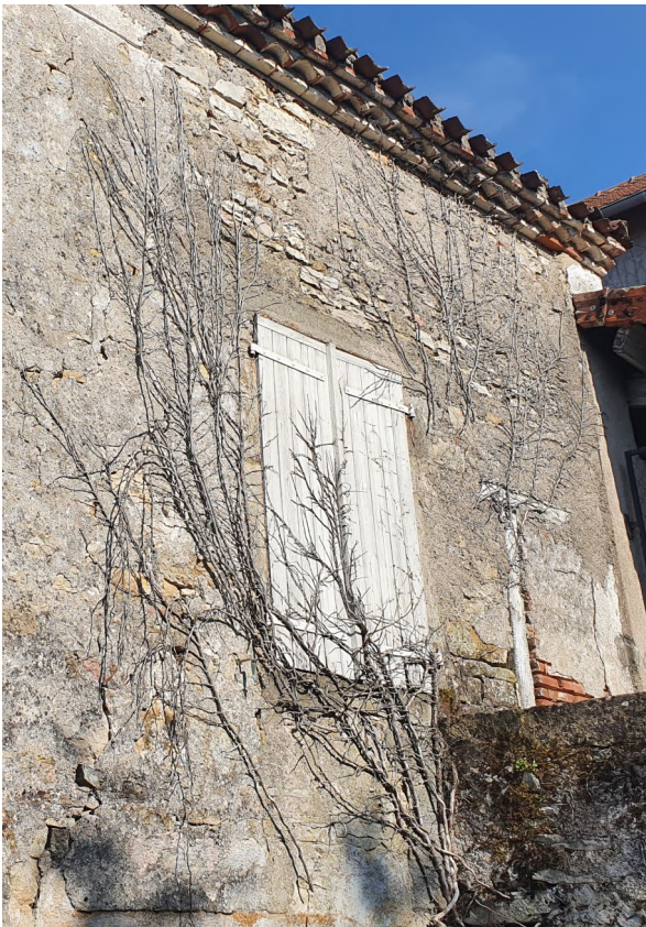
Un appartement fermé, c'est une perte pour tous

Dans la dernière édition de la Gazette, l'accent était mis sur l'intérêt de ne pas attendre pour mettre en marché des terrains actuellement constructibles (zones U et AU) sur le fondement du PLU (Plan local d'urbanisme) en vigueur. La situation est la même pour les commerces, pour vendre, il faut annoncer et chercher... Le « bouche à oreille » ne suffit pas. Un acheteur ne se présentera pas chez un propriétaire vendeur s'il n'a pas l'information. En d'autres termes, pour vendre, il faut faire savoir et là, quoi de mieux que de confier cette mission à un professionnel ?